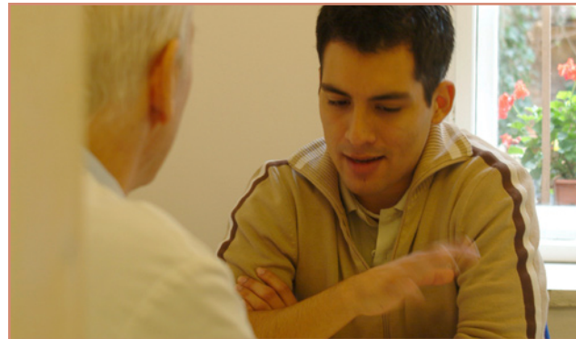
openmedi © N. Feineria

Приемное время: по вторникам с 14.30 до 16.30