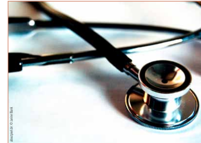
aboutmed.de © Janine Blank