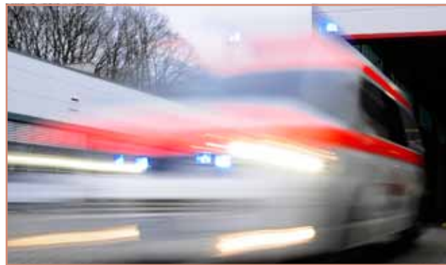
openMed © Arno Bärner